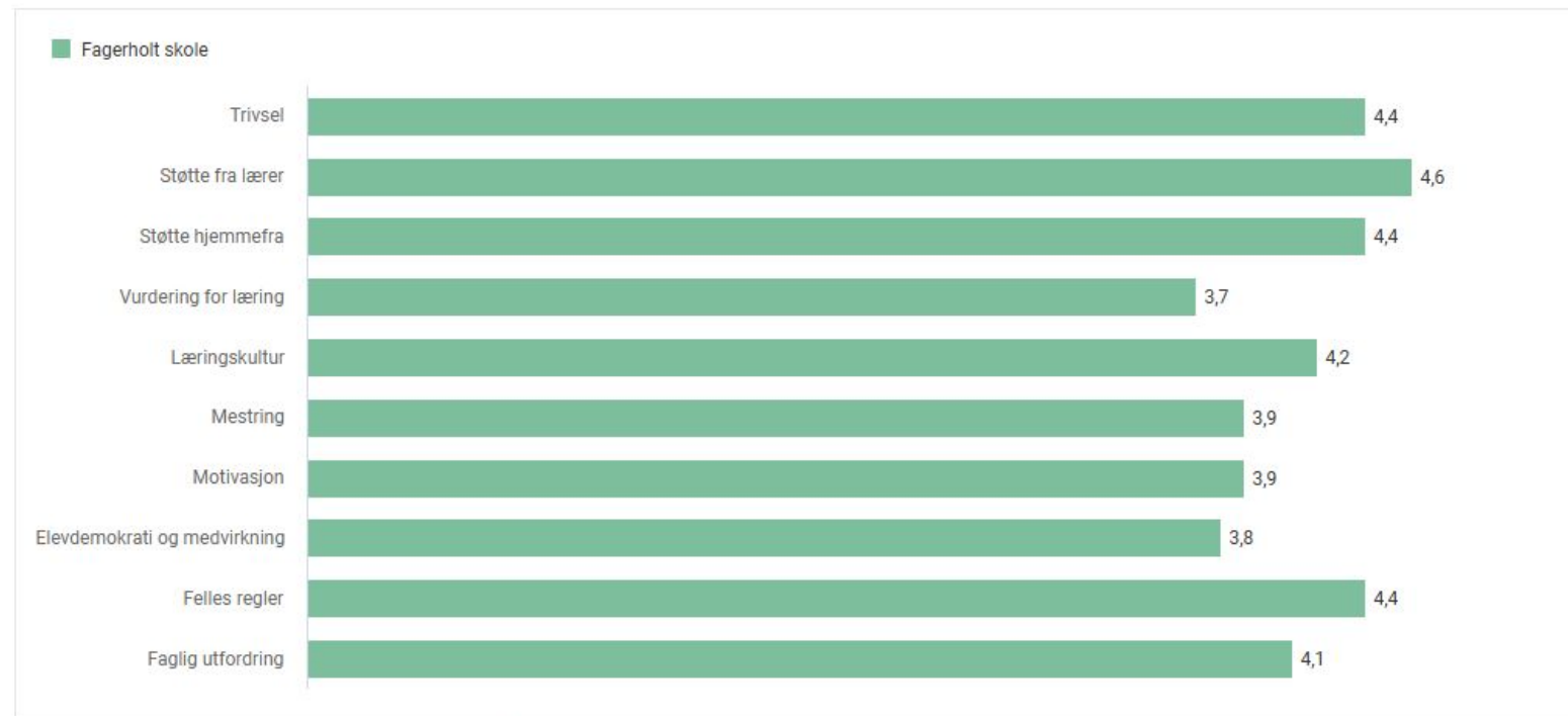
Elevundersøkelsen – Alle indikatorer – 5. årstrinn

2024-25, Fagerholt skole, 5. årstrinn, Alle indikatorer, Alle eierformer, Alle kjønn